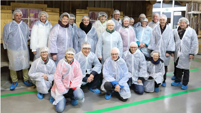
Bevor wir in die Gewölbekeller durften, mussten wir uns mit Plastikmäntel, -haube und -schuhe einkleiden.