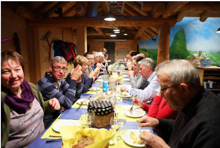
In der gemütlichen Alphütte genossen wir Gschwellti mit Käse à discretion...

Auf diesem Weg möchte ich mich nochmals verabschieden in Folge unseres Wohnortwechsels. Es war eine tolle Zeit mit vielen wunderbaren Menschen. Herzlichen Dank, dass ich in den vergangenen fünf Jahren ein Teil von euch sein durfte.