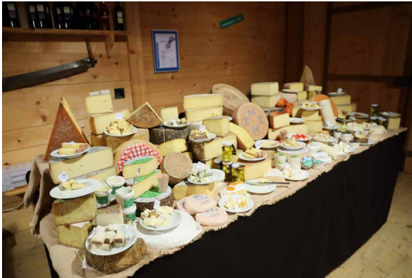
Das Käsebuffet mit x verschiedenen Sorten Käse. Die Auswahl war so riesig, dass man gar nicht recht wusste, wo anfangen...