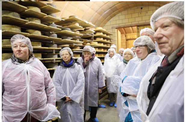
In den Käsekellern haben einige Mühe mit atmen, da der Ammoniakgeruch sehr stark war.

Interessant war es zudem, mehr über die Herkunft und Merkmale der Käse zu erfahren wie zum Beispiel über den Holderbäsele-Käse (ingerieben mit Holundersaft), den nussigen Bockshornkäse oder den Chämifäger Käse.