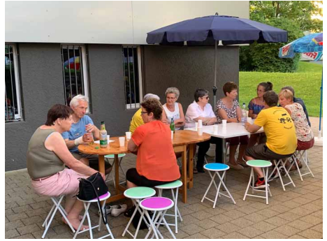
Gemütliches Beisammensein bei schönstem Wetter