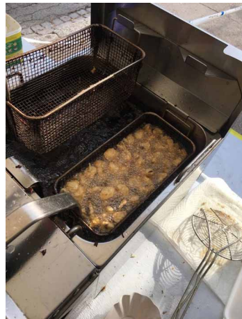
Sonntagabend; 18 Uhr; letzte Portion Pilze

Total 60 kg Champignons gingen an diesem Wochenende über die Theke. Pünktlich zum Festschluss reichte es dann auch Petrus und so wurden wir zum Abbau ordentlich geduscht.