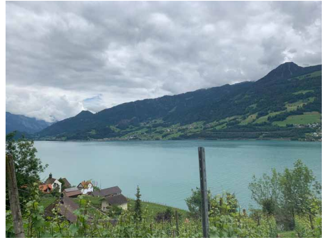
Spaziergang zum Restaurant, dem schönen Walensee entlang

Nachdem Essen teilten wir uns in 2 Gruppen auf. Die Wanderer nahmen nun den Weg nach Betlis in Angriff, während die Nicht-Wanderer die Aussicht und das mediterrane Klima noch geniessen konnten. Eine Stunde lang ging es sehr steil bergauf. Der Weg führte über Stock und Stein und war teilweise mit Ketten und Drahtseilen gesichert. Nachdem wir die fast 300 Höhenmeter hinter uns hatten ging es wieder bergab nach Betlis. In Vorderbetlis kamen die bekannten Seerenbachfälle zum Vorschein. Die Seerenbachfälle bestehen aus 3 Stufen. Alle drei Stufen zusammen messen knapp 600 Meter. In Betlis angekommen, trafen wir auf die Nicht-Wanderer, die sich im Restaurant eine Erfrischung gönnten. Auch für uns reichte die Zeit noch für eine kurze Erfrischung in Form eines Getränks oder einer Glace.