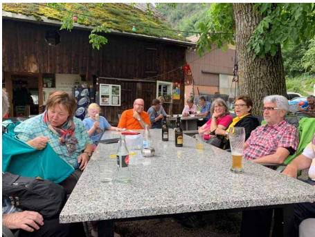
Erfrischung nach der Wanderung

Nachdem Essen teilten wir uns in 2 Gruppen auf. Die Wanderer nahmen nun den Weg nach Betlis in Angriff, während die Nicht-Wanderer die Aussicht und das mediterrane Klima noch geniessen konnten. Eine Stunde lang ging es sehr steil bergauf. Der Weg führte über Stock und Stein und war teilweise mit Ketten und Drahtseilen gesichert. Nachdem wir die fast 300 Höhenmeter hinter uns hatten ging es wieder bergab nach Betlis. In Vorderbetlis kamen die bekannten Seerenbachfälle zum Vorschein. Die Seerenbachfälle bestehen aus 3 Stufen. Alle drei Stufen zusammen messen knapp 600 Meter. In Betlis angekommen, trafen wir auf die Nicht-Wanderer, die sich im Restaurant eine Erfrischung gönnten. Auch für uns reichte die Zeit noch für eine kurze Erfrischung in Form eines Getränks oder einer Glace.