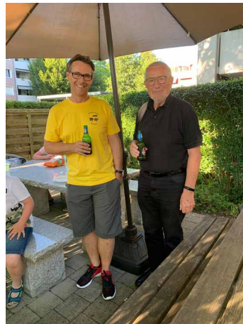
Bei diesen Temperaturen braucht es diese wohltuende Erfrischung