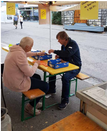
Sonntagmorgen; 10kg Pilze schneiden

Am Sonntagmorgen erwartete uns schon das Team was uns den Nachschub besorgte und auch gleich die 10 kg Champignons schneiden sollte. Relativ schnell waren die ersten Portionen verkauft und wir waren uns sicher, das ist heute nur eine Frage der Zeit bis es heisst „Ausverkauft“. So sollte es dann auch kommen – 18 Uhr – Ausverkauft!